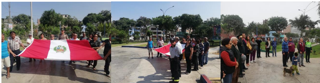
Fotografías de la Acción Cívica en el Parque de la